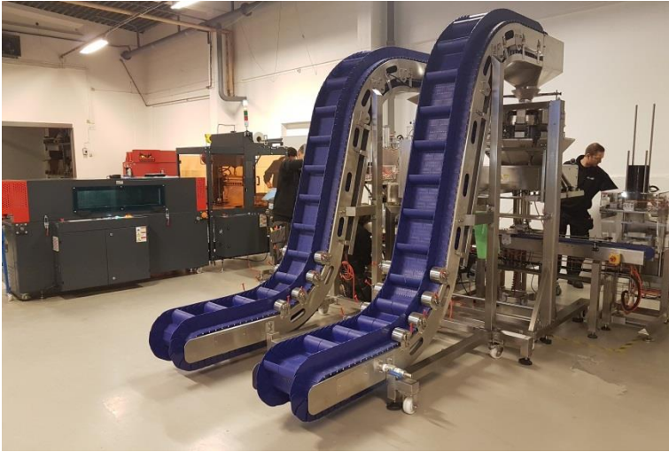
Bilder av spannlinjje: